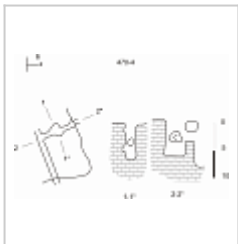
Сары-Кая4 план и разрез