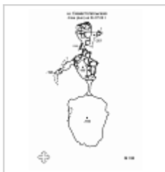
Севастопольская План дна.