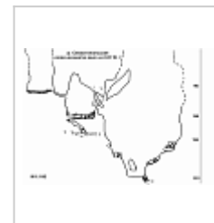
Севастопольская Разрез-развертка дна.