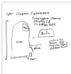
Глазомерная съемка План, сечения. 2023