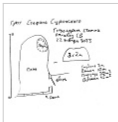
Глазомерная съемка План, сечения. 2023