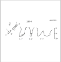
Снеговая План и разрезы