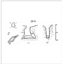
Снежная План и разрезы