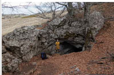
Вход в пещеру Холодная