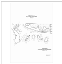
Суук-Коба План, разрез