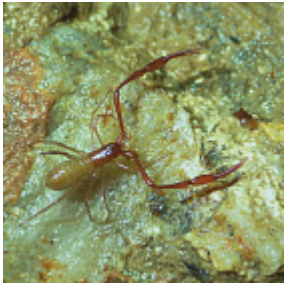
Pseudoblothrus roszkovskii (Redikorzev, 1918)