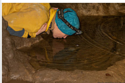
Ванночка с водой