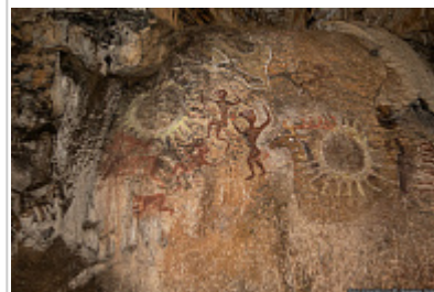
Современная наскальная живопись