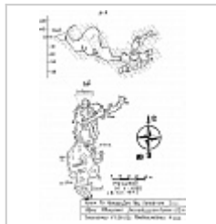
План-разрез 2002 План-разрез 2002