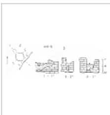
Тарханкутская 1 План и разрез