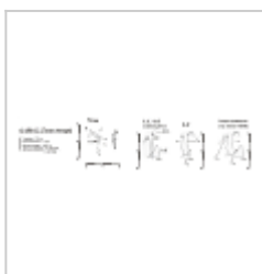
План и разрез Съемка Верченко А.