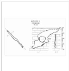
547-6 Трещинная План, разрез