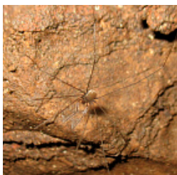
Nemaspela caeca (Grese, 1911)