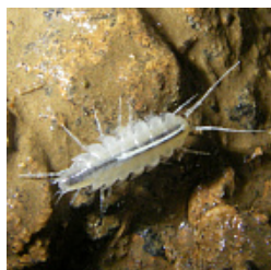
Taurologidium stygium Borutzky, 1950