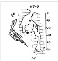
Шапито План и разрез