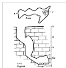
План и разрез карстовой пустоты в селе Заводском иллюстрация к статье