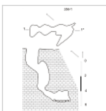
Пещера Щепинского План и разрез