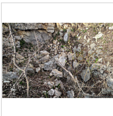
Обвал на месте входа