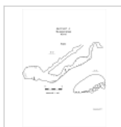
Эскаваторная_Разрез Разрезы пещеры