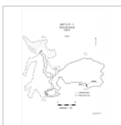
Эскаваторная_План План пещеры