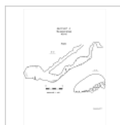
Эскаваторная_Разрез Разрезы пещеры