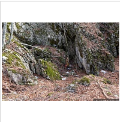
Вход в пещеру Юбилейная