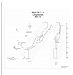
Юбилейная План, разрез