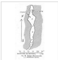
План и разрез Съемка Крубер А.А.