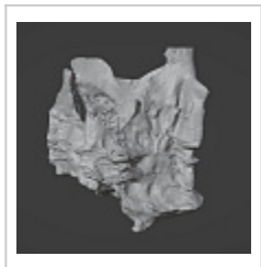
3d съемка Съемка лидаром айфона.