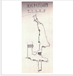
топа скан с отчета