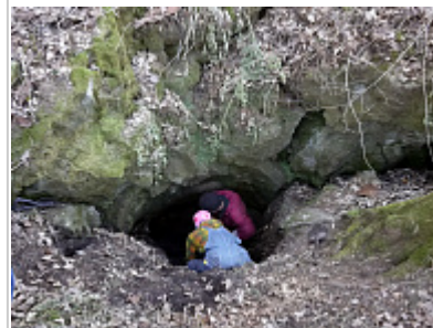
Вход после раскопа