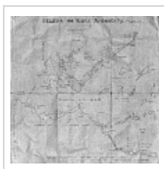
Фридмана разрез - развёртка