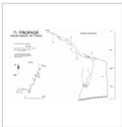
Разрез-развёртка и план Съёмка с\к "Сокольники- РУДН", 2006 г.