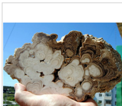
Срез королита из пещеры

Вход в пещеру Б. Байдинская Автор: Из архива ИОКС 2008