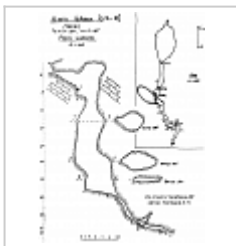
Разрез-развёртка и план Съёмка с\к "Сокольники" (Москва), 1988 г.