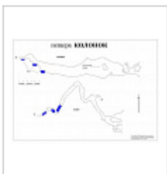
карта план и разрез-развертка