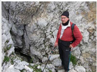
У предполагаемого входа пещеры Пионерская