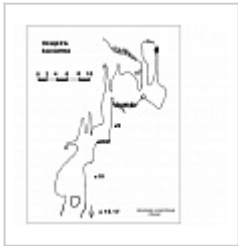
топа глазомерная съемка