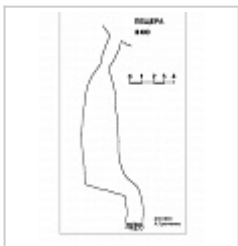
топа глазомерная съемка