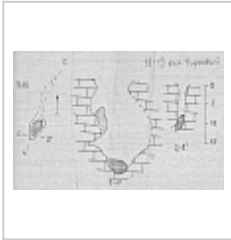
Топосъемка Топосъемка из Кадастра карстовых полостей массива Фишт (1986 г.)