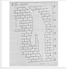
Топосъемка Топосъемка из Кадастра карстовых полостей массива Фишт (1986 г.)