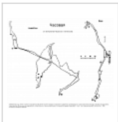
Разрез-развёртка и план По материалам Перовского спелеоклуба.