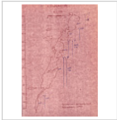
разрез скан с отчета