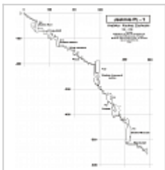
Разрез Съёмка 2010 г.