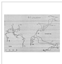
Топосъемка Топосъемка из Кадастра карстовых полостей массива Фишт (1986 г.)