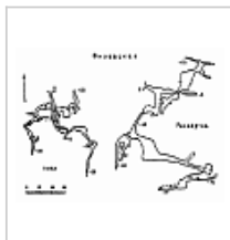
Топосъемка Топосъемка из сборника: В.Н.Дублянский и др. Крупные карстовые полости СССР. - 1987