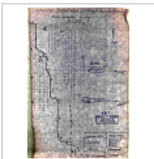
Топосъемка в ходе реставрации Топосъемка из отчета А.Е.Петрова 1974 г. на промежуточном этапе цифровой реставрации