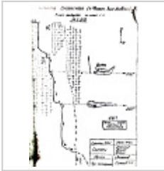
Топосъемка Топосъемка из отчета А.Е.Петрова 1974 г.