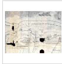
Схема подходов к пещере МСС 107 и другие объекты на фрагменте поврежденной карты-схемы из отчета А.Е.Петрова 1974 г.