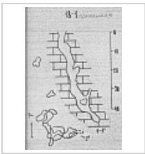
Топосъемка Топосъемка из Кадастра карстовых полостей массива Фишт (1986 г.)