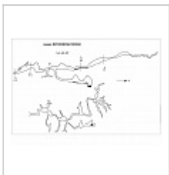
разрез развертка и план Копия со съемки спелеологов Хабаровска