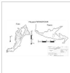
План и разрез (Медведев А.) Топосъемка Медведева А.