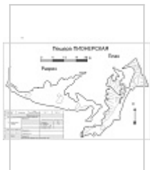
План и разрез (Медведе в А.) Топосъемк а Медведева А. Компьютер ная обработка Кириченко В.С.