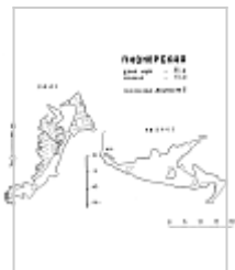
План и разрез (Медведе в А.) Топосъемк а Медведева А. Компьютер ная обработка Кириченко В.С.