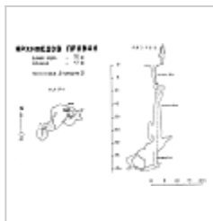
План и разрез (Медведев А.) Топосъемка Медведева А.