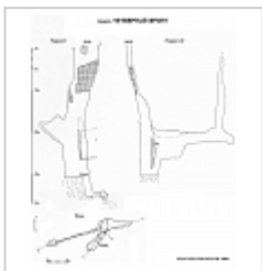
4-й фронт съемка План и разрезы пещеры 4-й фронт. Автор Власенко В.В. 1983г