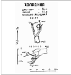
План и разрез (Медведев А.) Топосъемка Медведева А.