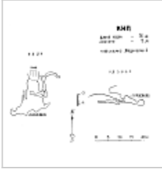
План и разрез (Медведев А.) Топосъемка Медведева А.