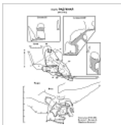
Радужная съёмка План и разрез пещеры Радужная