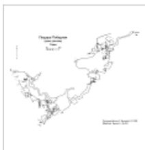
Победная план План пещеры Победная