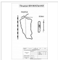
Кинжалная Один из вариантов копий съемки пещеры